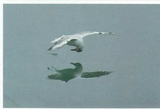
Oiseau de Méditerranée. Auteur: JP MICHEL. Appareil photo: NIKON D70 – Diaphragme: f/5,6 – Longueur de focale: 400 mm – Temps d'exposition: 1/640 s.