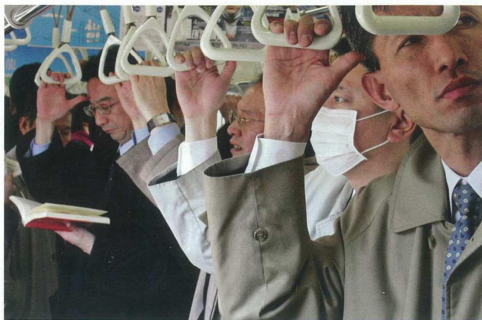
Dans une rame de métro à Tokyo. Appareil photo: DiMAGE F100 – Diaphragme: f/4,0 – Longueur de focale: 19 mm Temps d'exposition: 1/60 s – ISO: 118.